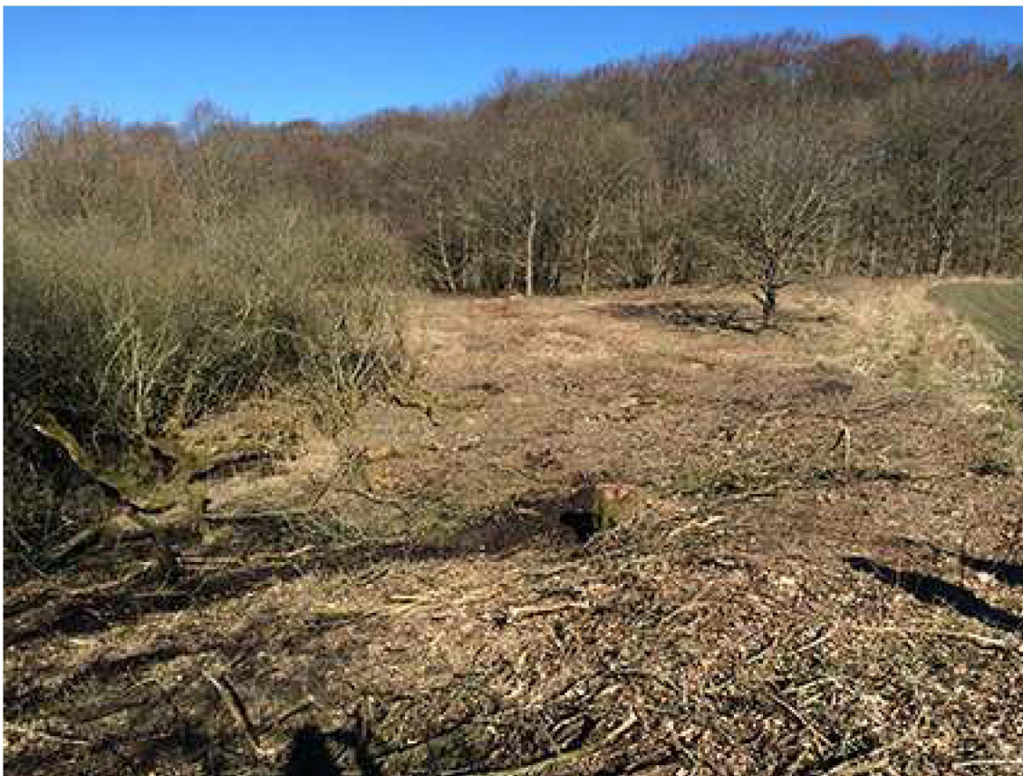
Rydning af buske- og træer på kalkoverdrev.

Indsatsen udføres af kommunerne og lodsejere i området og gennemføres i videst muligt omfang gennem frivillige aftaler. Der findes blandt andet en række tilskudsordninger, som kan søges gennem Landbrugs- og Fiskeristyrelsen.