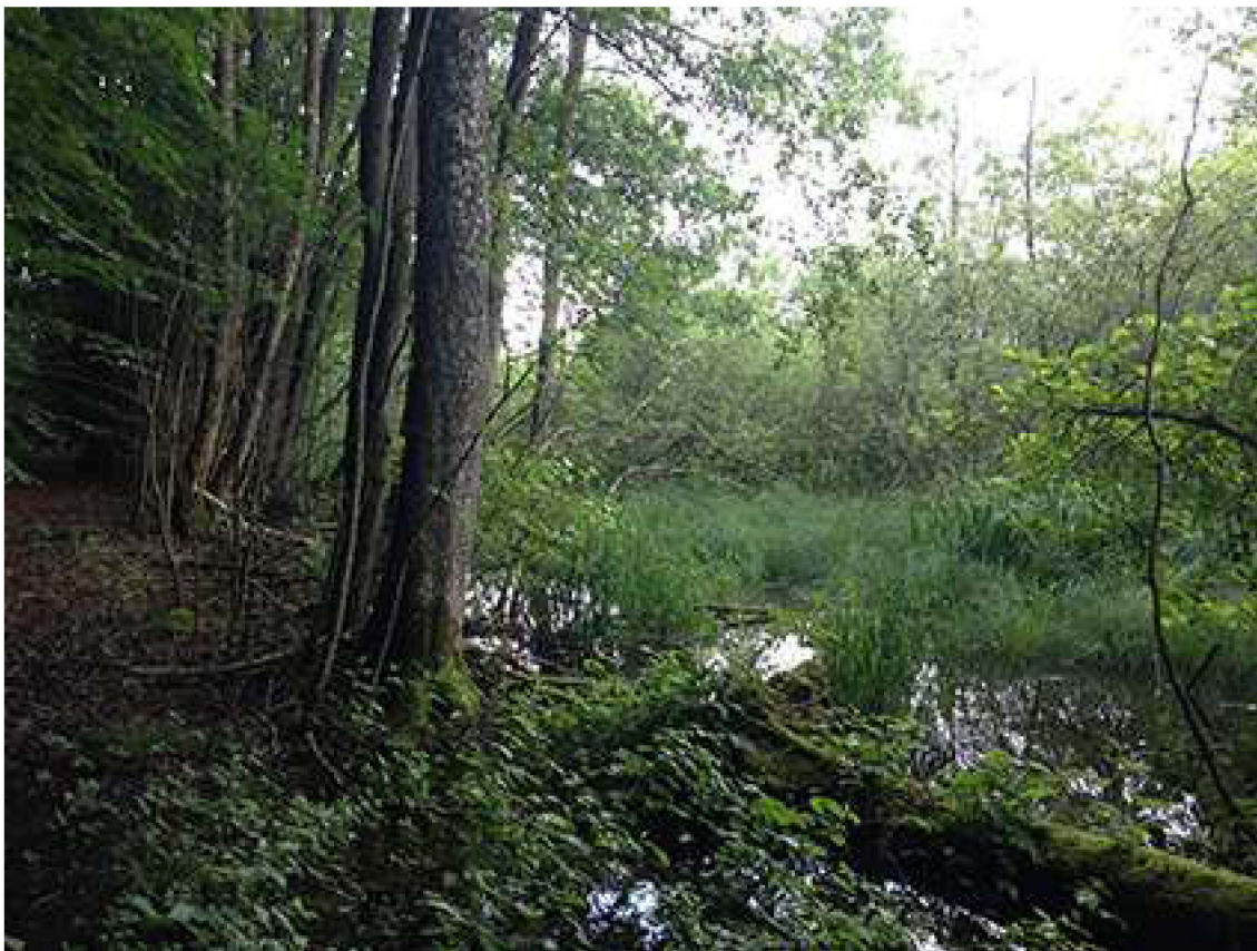
Elle- askeskov i høj naturtilstand ved Tåstrup sø.

Projekterne gennemføres ved frivillige aftaler, og derfor er det i mange tilfælde ikke på nuværende tidspunkt muligt at beskrive hvornår projekterne fysik bliver udført. Kommunen vil i hvert enkelt tilfælde sørge for, at relevante interessenter bliver inddraget.