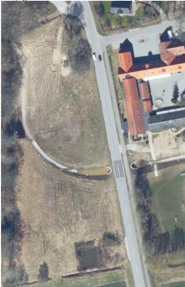
Figur 1 - Oversigt over projektområdet

Området hvor vendeplads og parkering etableres, er i dag et grønt område. Langs kanten løber en cykelsti, der er forbindelse til Veng skole i en tunnel under Låsbyvej. Denne tunnel har ofte stået under vand, og der ønskes derfor af denne tunnel også kan afvandes til det kommende bassin.